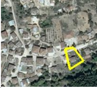
Resim 1; Planlama Alanının Uydu Görüntüsü

Planlama alanı, 1/25.000 ölçekli İznik Gölü Nazım İmar Planı sınırları içerisinde yer almaktadır.